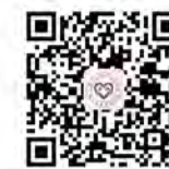
学生资助管理中心