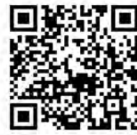
扫码查看缴费指南